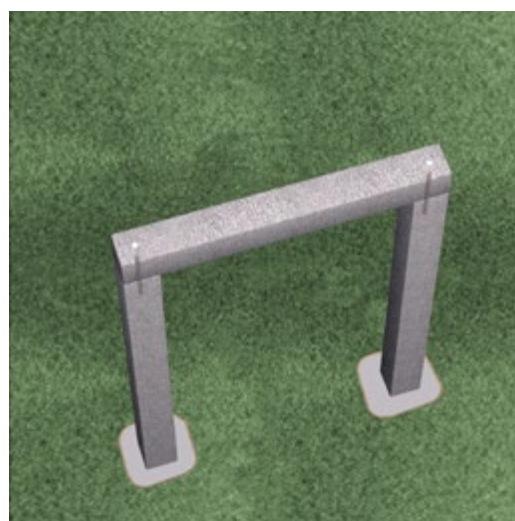
Armeringsjärnet hjälper till att stabilisera portalen. Hålen muras igen så att armeringsjärnet inte riskerar att rosta.

Denna broschyr har som syfte att inspirera och visa exempel på hur olika arbeten kan utföras. Finja ansvarar inte för konstruktionslösningar då omgivningen, underlagets beskaffenhet och kvalitet spelar viktig roll. För aktuell information se alltid www.finja.se .