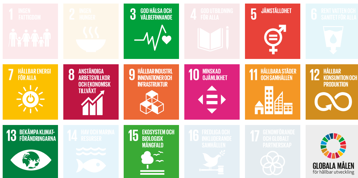
FN:s mål för hållbar utveckling

Agenda 2030 och de 17 Globala målen för hållbar utveckling är grunden för vårt långsiktiga arbete.